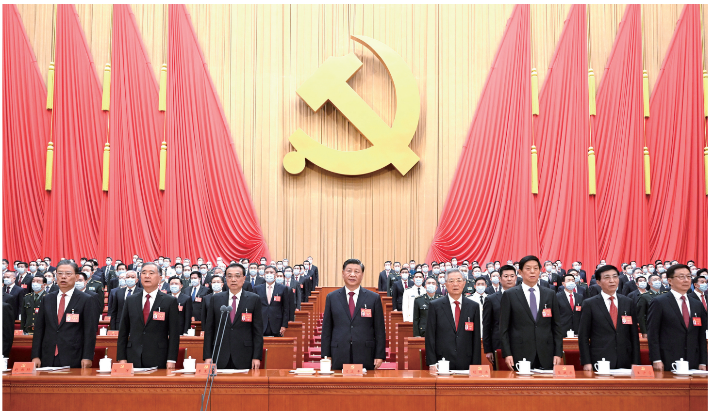
10月16日,中国共产党第二十次全国代表大会在北京人民大会堂开幕。这是习近平、李克强、栗战书、汪洋、王沪宁、赵乐际、韩正、胡锦涛涛在主席台上。

新华社北京10月16日电 凝心聚力擘画复兴新蓝图,团结奋进创造历史新伟业。举世瞩目的中国共产党第二十次全国代表大会16日上午在人民大会堂开幕。