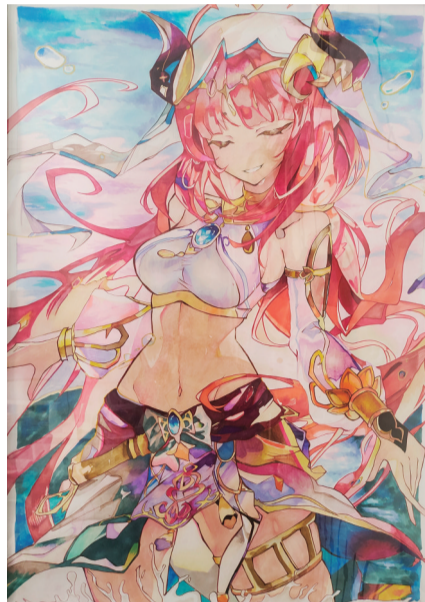
济宁市实验小学总校区 五年级七班 马双馨