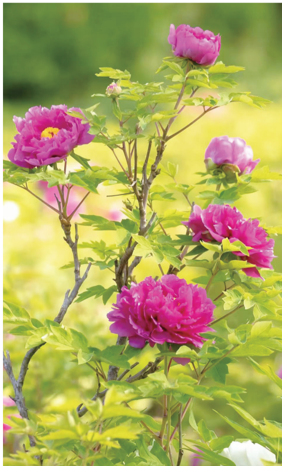
紫霞缀春枝 张柳春