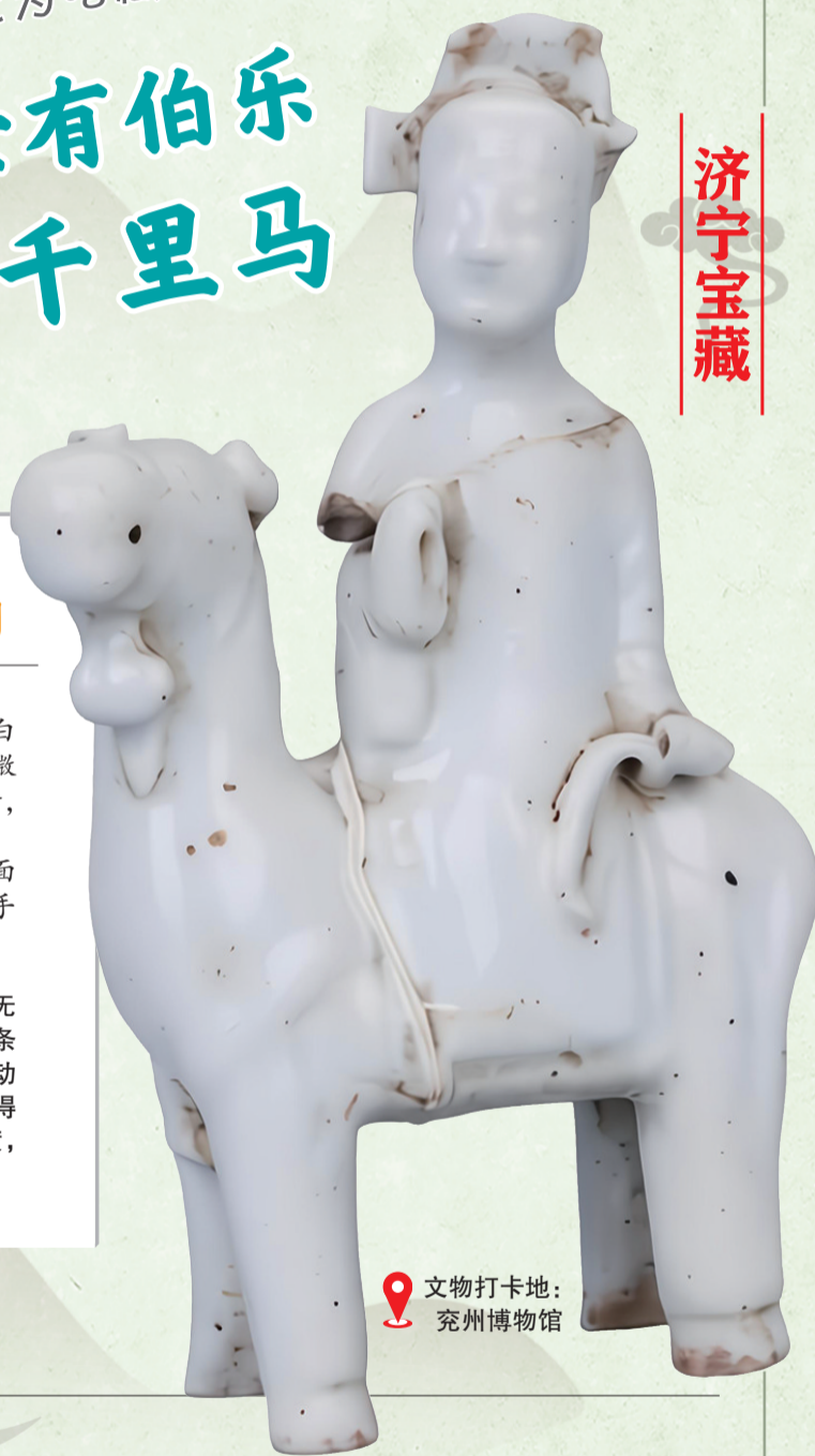
文物打卡地：兖州博物馆

骏马设计简洁传神，虽无细节堆砌，却通过精准的线条拿捏，展现出蓄势待发的灵动神态。骑马者双手姿态自然得体，一抬一搭间尽显沉稳气度，整体作品形神兼备。