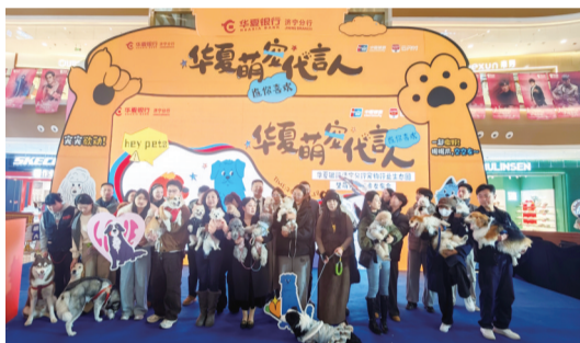
爱宠人士齐聚一堂,共同见证这一时刻

为回馈现场嘉宾,发布会设置了三轮抽奖环节,共抽取三等奖6名、二等奖2名、一等奖1名,幸运嘉宾收获了精美礼品。同时,工作人员还详细解读了萌宠主题卡的专属权益,让爱宠人士心动不已,会场