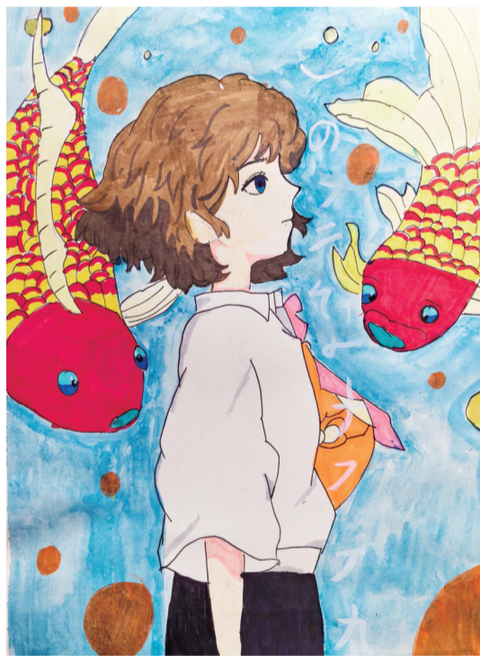
济宁市实验小学任兴校区 四年级八班 段晓希