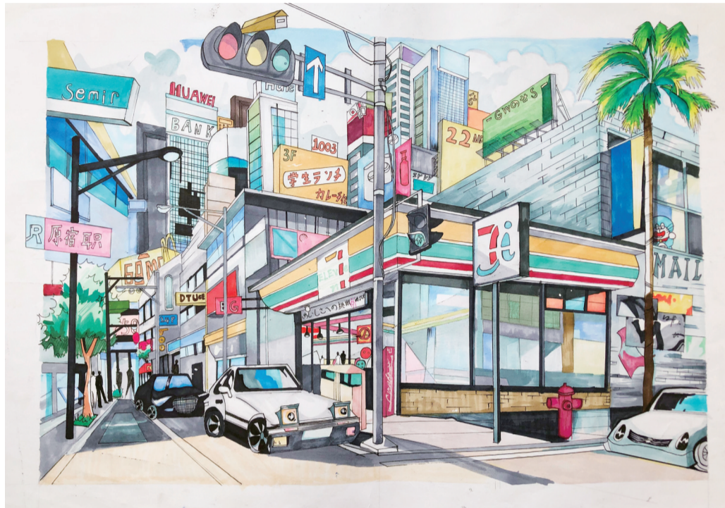
济宁市实验小学总校区 五年级七班 马双馨