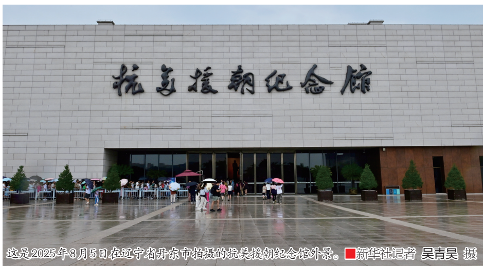
这是2025年8月5日在辽宁省丹东市拍摄的抗美援朝纪念馆外景。

“应当参战，必须参战”。值此危急关头，应朝鲜党和政府请求，中国党和政府以非凡气魄和胆略作出抗美援朝、保家卫国的历史性决策。1950年10月19日，中国人民