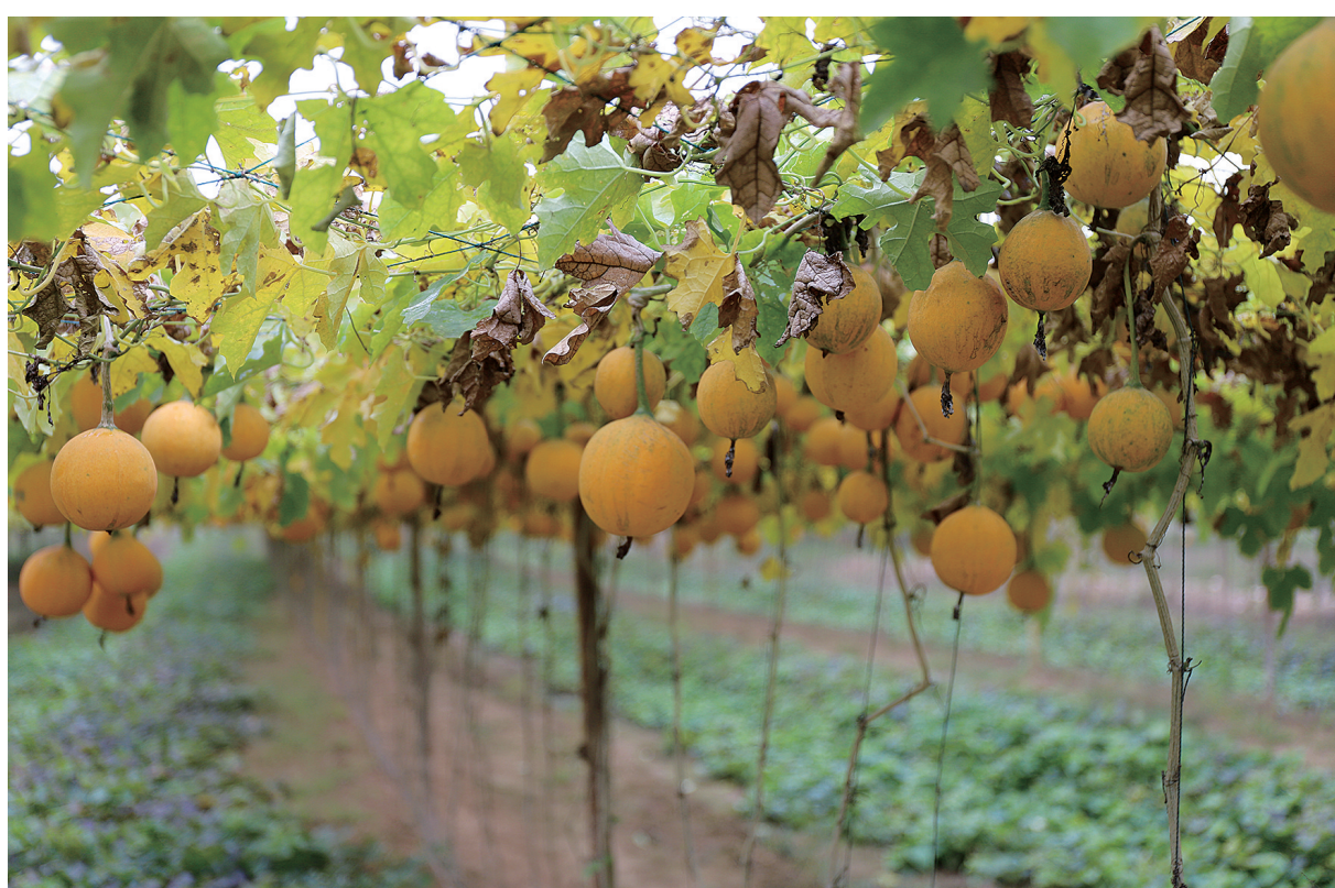
曲阜市吴村镇把中医药种植作为农业结构调整和乡村振兴的重要抓手,大力发展瓜蒌、黄精等特色种植产业。通过“党支部+合作社+农户”的模式,形成规模效应,提高市场竞争力。

济宁高新区接庄街道便民服务中心深入推进残疾人服务“一件事”集成办理,将涉及残疾人的多项关联业务进行梳理整合,实现“一次告知、一表申请、一套材料、一窗受理”,让居民办事更便捷、更舒心。