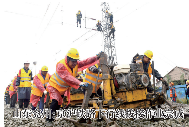
山东兖州：京沪铁路下行线拨接作业完成