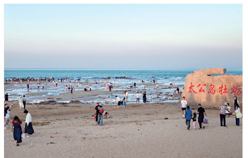
牡蛎公园赶海的游客