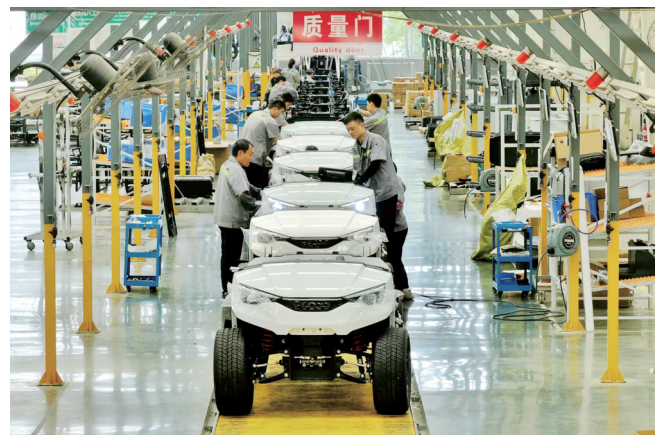
新能源专用车生产线