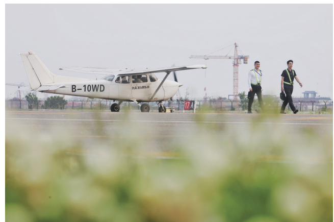
通用机场迎来新学员