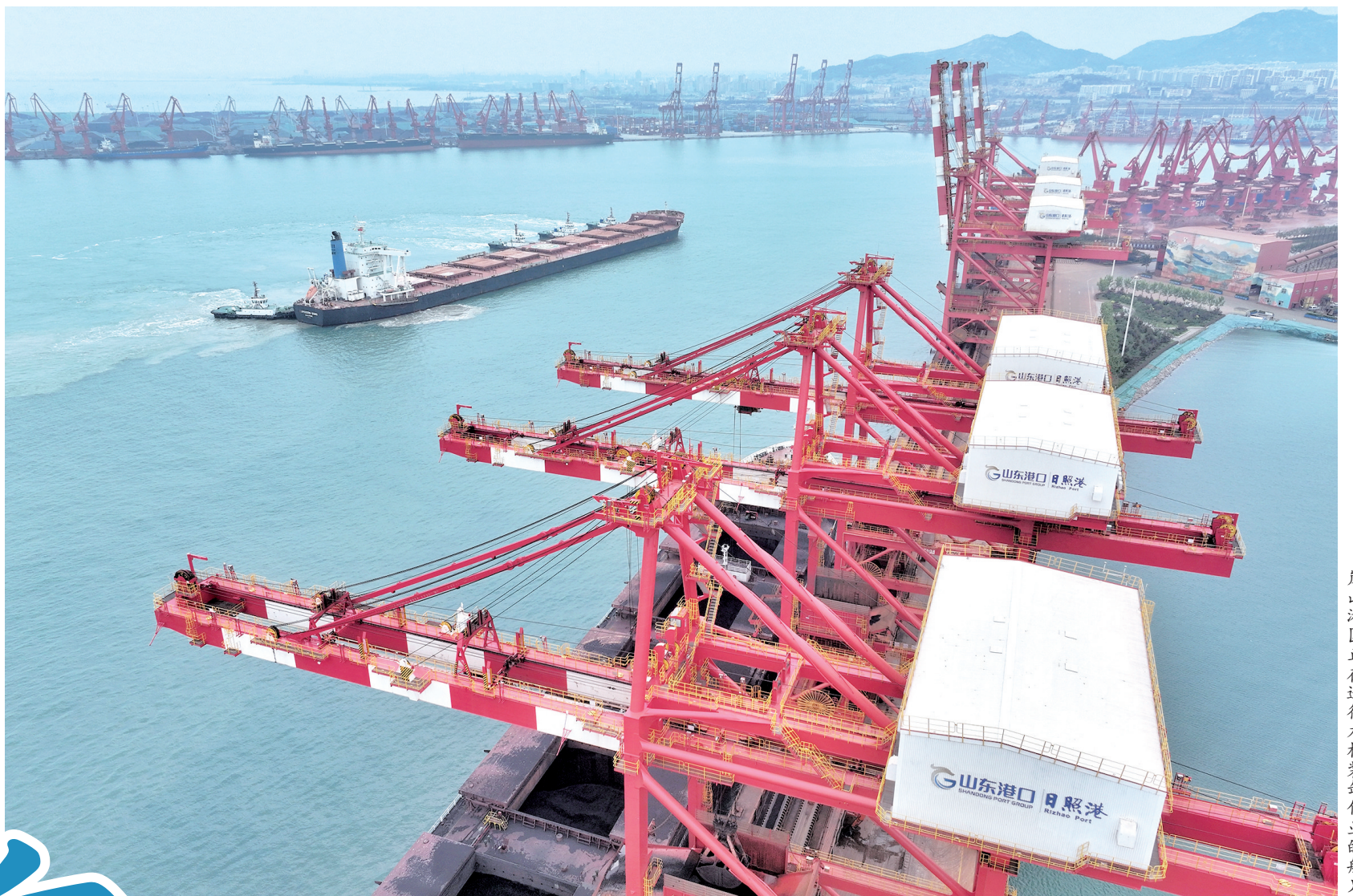
岚山港区正在进行木材装卸作业的船只