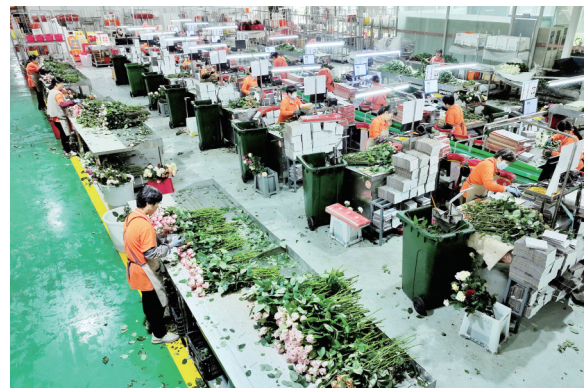
现代化农业产业园