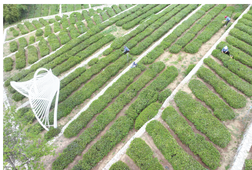
安东卫街道北门外1966茶园