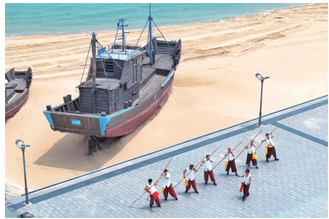
多岛海帆广场上岚山渔民号子表演