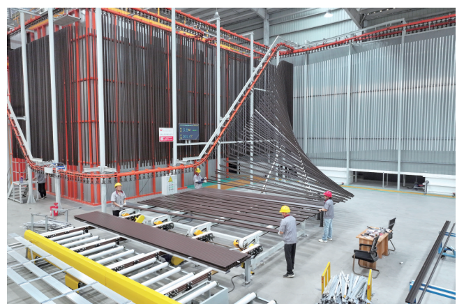
铝型材自动喷涂车间