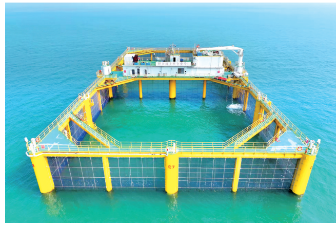
“海上粮仓壹号”系列三文鱼养殖网箱