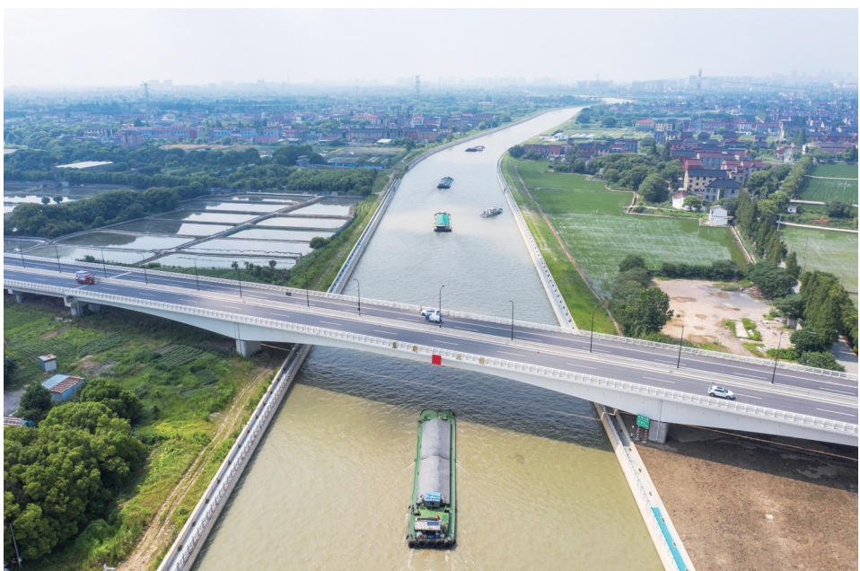
2023年7月18日,首批通航货船进入京杭运河杭州段二通道驶往钱塘江。

(上接1版A)19日上午,习近平听取青海省委和省政府工作汇报,对青海各项工作取得的成绩给予肯定。