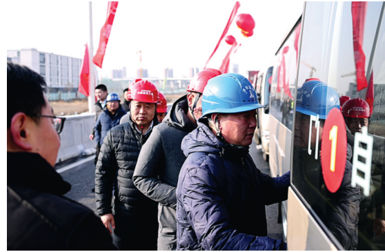
一线建设者乘车参观