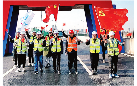
建设工人庆贺通车