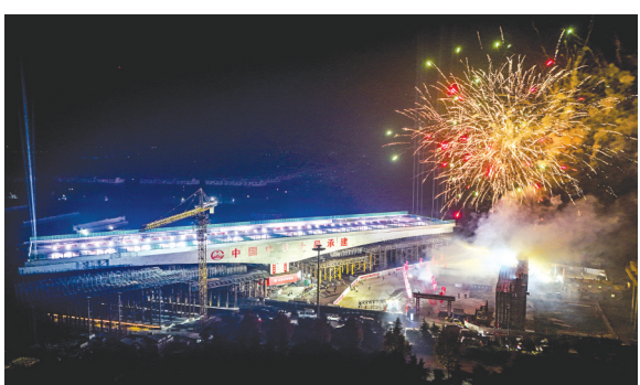
上跨新兖铁路立交桥转体