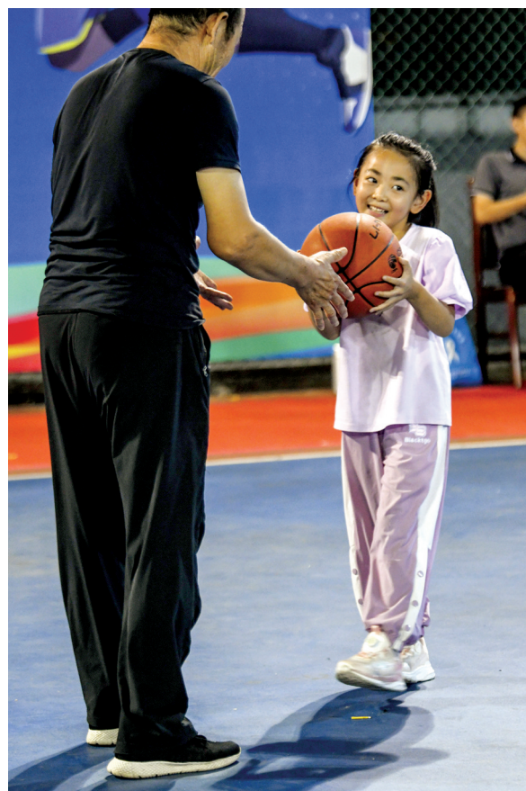
童心飞扬,篮球筑梦