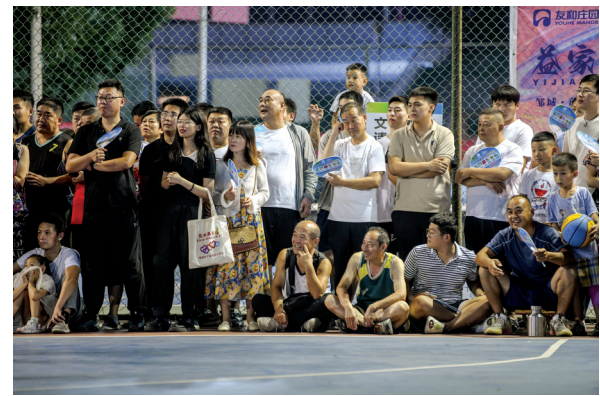
场场爆满,热闹非凡