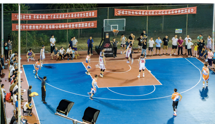
你来我往,攻守兼备