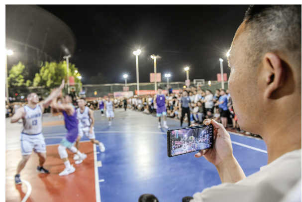
热血沸腾,现场直播