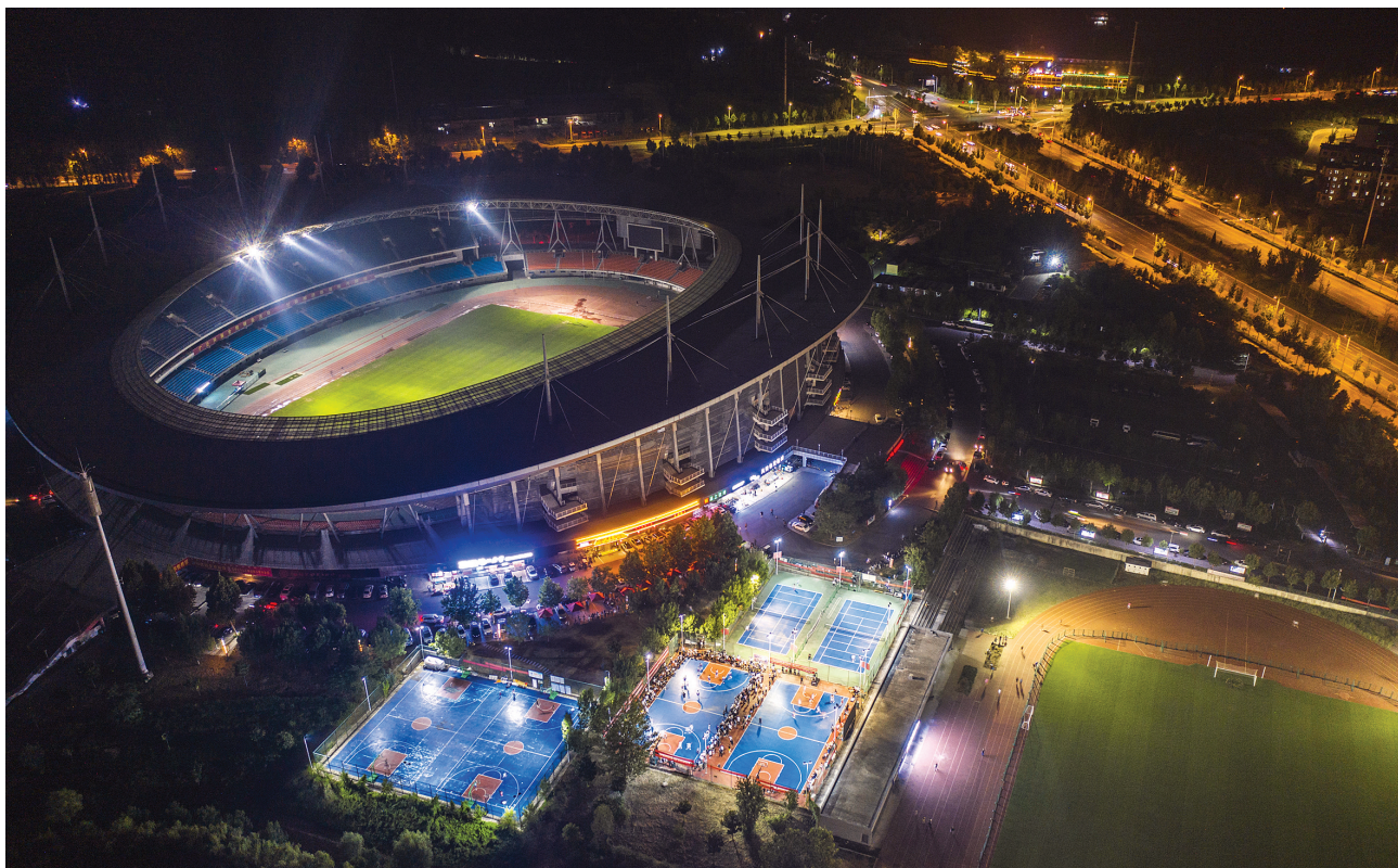
全民健身,精彩“篮”不住

本次赛事以球为媒,形式多样,既包含促销会展、文明创建,又有精彩赛事、邻里互动,让篮球爱好者和辖区群众切磋了技艺,联络了感情,丰富了生活,激发了辖区居民参与全民健身的热情。此外,本次比赛不仅展示了辖区内党员干部群众团结协作、健康向上的良好精神风貌,更增进了各社区、各单位间的了解,对推动街道工作再上新台阶起到积极作用。