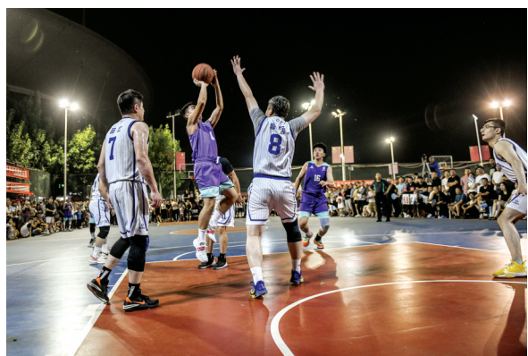
精彩瞬间,层出不穷