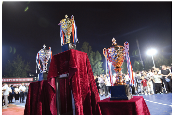
激烈角逐,花落各家