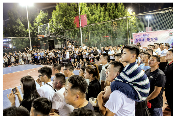
“小”地方燃起“大”热爱