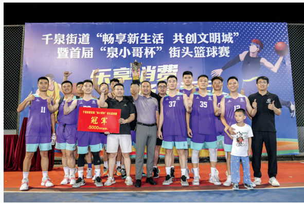
夺得冠军,再约来年