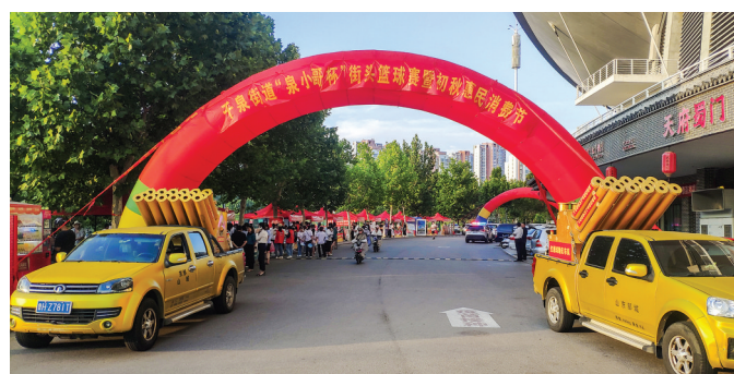
惠民消费节同期举办