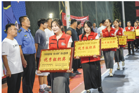
赛出球技,联出友谊