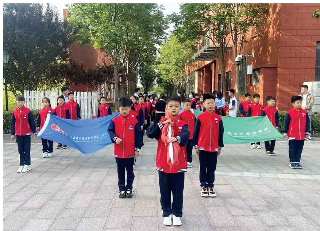
5月15日,济宁修文外国语学校举行了以“毅力是成功的基石”为主题的升旗仪式。本次升旗仪式由三年级三班主持。在嘹亮的口号声中,同学们组成的国旗护卫队迎着朝阳,迈着整齐的步伐,昂首挺胸,庄严地步入会场。嘹亮的国歌响彻校园上空,孩子们心中激荡起浓浓的爱国的情怀。 ■通讯员 宋培龙 摄

融合发展,开创“如康家园”医园结合新模式。瞳里镇发挥镇残联组织效能的同时,积极链接社会资源,与济宁儒医医院合作,携手以健康医疗服务为主导,把优质的医疗资源下沉到基层,打造集“医养结合+日间照料+康复救助+就业培训+志愿服务”五大功能于一体的医园结合新模式。瞳里镇与济宁儒医医院携手共建,融康、养、护为一体,专业团队与志愿者相结合,组建了“如康家园”家庭医疗照护、生活照料、托养康复、辅助性就业四支专职队伍,为瞳里镇广大残疾人提供全生命周期的照护。