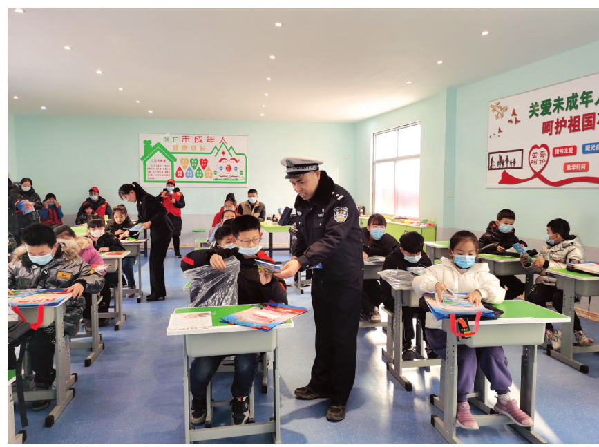
▲为切实加强广大小学生交通安全意识,近日,梁山交警大队联合县民政局走进辖区马庄村开展“儿童之家”启动仪式,民警为在场儿童开展交通安全知识讲解。利用通俗易懂的语言和生动形象的课件,讲解了应如何遵守红绿灯通行、过马路走人行横道等知识。