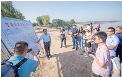
采访团一行在黄河东明霍寨险工了解情况

黄河宁，天下平。菏泽市牢牢抓住黄河流域生态保护和高质量发展上升为国家战略的历史机遇，以“功成不必在我”的精神境界、“功成必定有我”的历史担当，主动作为、攻坚克难，努力推动黄河流域生态保护和高质量发展不断取得新进展，切实做好“让黄河成为造福人民的幸福河”这篇大文章。