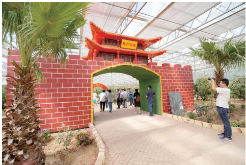
东明焦园春博园现代农业产业园