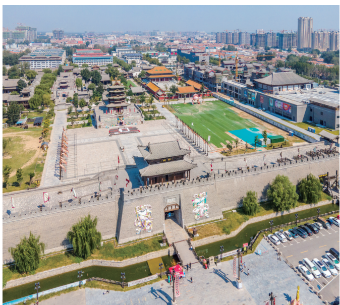
鄄城县水浒好汉城