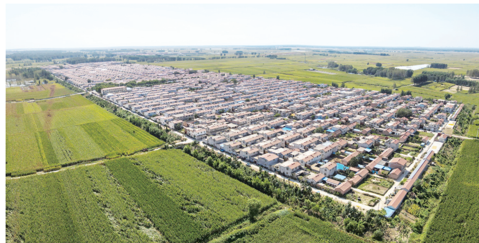
鸟瞰东明县长兴集乡竹林新村