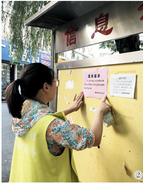
①工作人员在一家图书文具店里进行检查。②古槐街道翰林街社区工作人员正在张贴静音提示。③④交警部门部分车辆、出租车、私家车等社会力量齐心护航。