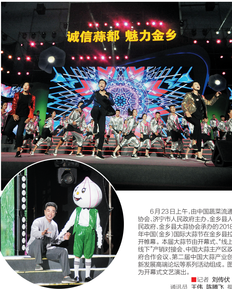
诚信蒜都 魅力金乡

有劳动能力的贫困户结合自身实际选择经营效益好、可持续发展能力强的产业,将扶贫专项资金整合注入投资,发展壮大特色产业。支持当地企业发展壮大产业项目,开发产业项目示范基地,辐射和带动周边群众尤其是贫困群众,增加经济收入。鼓励困难群众通过土地流转、承包、就业、创业、学习现代农业发展技术等方式参与其中。