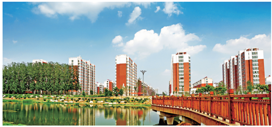
图为蓝天白云下的金济河沿岸。

乡县打出的大气整治“组合拳”效果明显,今后如何保持是市民关心的热点。对此,金乡县对大气污染问题继续保持高压态势,绝不让改善成果付诸东流。