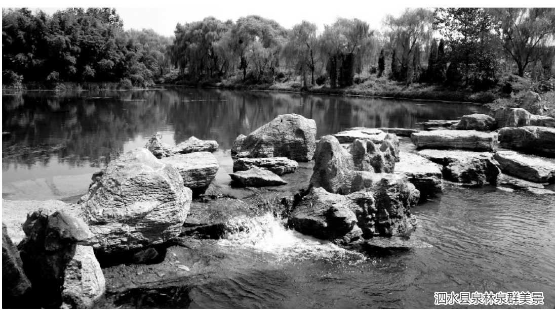
泗水县泉林泉群美景

水环境治理持续推进。强力推进生态文明建设，围绕城市中心城区，积极建设城市水生态环境。按照生态河道的建设目标，打造“一环八水绕济宁，十二明珠映古城”水城风貌。积极建设南四湖湿地，初步形成环南四湖的水生态圈。推进金乡县、泗水县等4县市区生态文明建设创建工作，着力打造各具特色的水生态文明城市，特别是金乡县实施“九湖五河”水生态治理，打造了“诚信蒜都、生态水城”风貌。今年新增嘉祥县老赵王河省级水利风景区，全市共创建国家级水利风景区7处、省级18处，排名全省前列。