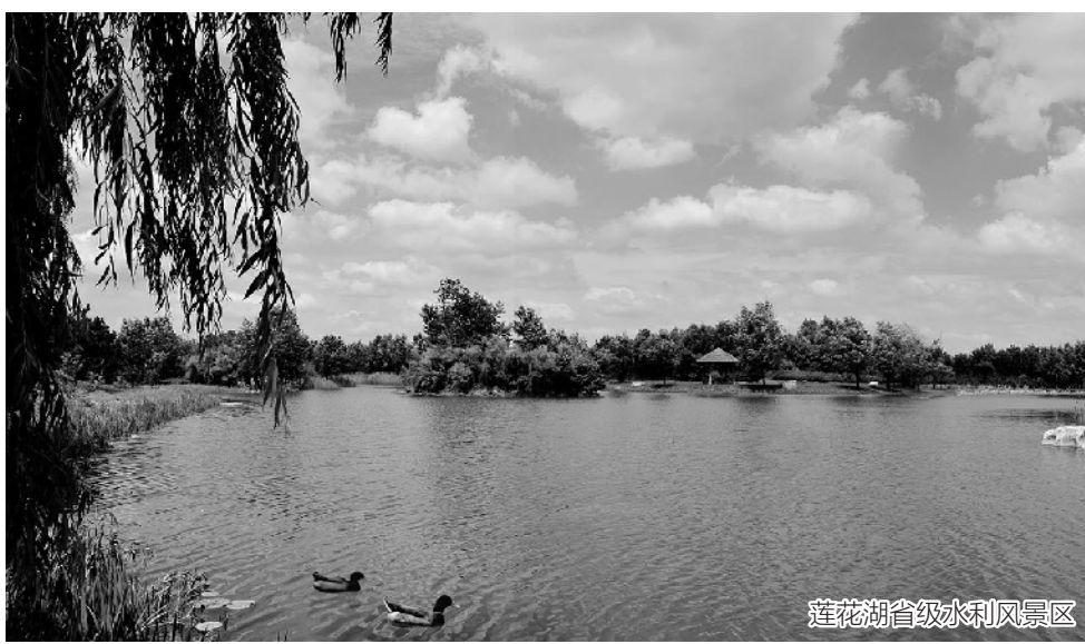
莲花湖省级水利风景区

深化放管服，铺设便民利企“高速路”。认真执行“三集中三到位”制度，积极开展审批事项合并、下放、消减工作，公布简政放权“五张清单”，将原有13项许可服务事项缩减为9项，在压减审批事项的同时最大限度提高行政效能，对涉及水利许可服务的所有事项，公开承诺办结时限。落实“双随机一公开”制度，加强审批事项事中事后监管，有效促进审批事项的规范服务。