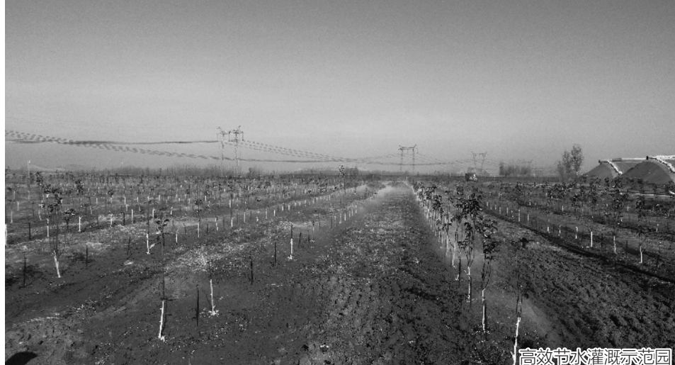
高效节水灌溉示范园

防汛抗旱工作取得新胜利。汛期全市累计降雨量535.4毫米，比去年同期偏多2%，比历年同期偏多7%。全市各级认真贯彻落实以行政首长负责制为核心的各项工作责任制，扎实做好防汛预案修订完善、安全隐患排查、防汛队伍建设及物资准备，严格值班值守，加强督导检查及应急会商，取得了防汛工作新胜利，全市河湖堤防无一决口，水库无一垮坝，城乡居民生产生活用水和南四湖生态用水安全得到保障。