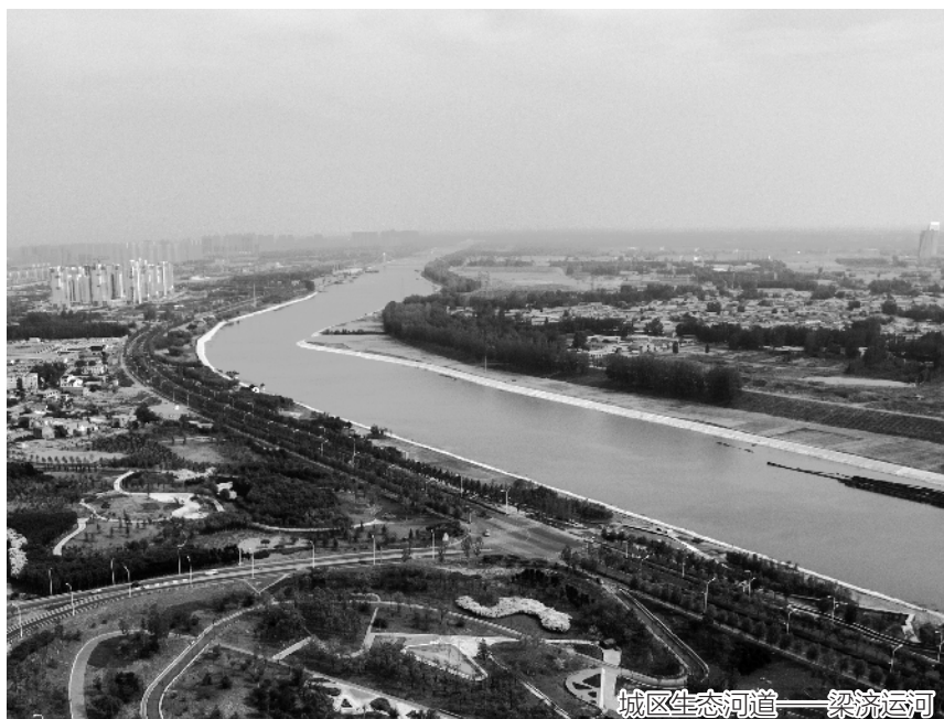
城区生态河道——梁济运河

作风建设进一步强化。严格执行中央八项规定精神及实施细则，修订完善《关于进一步规范经费支出内部控制的办法》、《机关差旅费管理办法》等规章制度。开展“解放思想大讨论、遵规守纪教育、干部作风大提升”活动，进一步严明工作纪律。深化精神文明建设，完成创建全国文明城市任务。严格执行《党政领导干部选拔任用工作条例》，选好用好干部。积极畅通群众诉求渠道，做好政务公开，强化水利宣传，维护信访稳定。深化拓展干部驻村联户工作，10个联建村、3个“第一书记”村、2个联建社区生产生活环境得到大力改善。