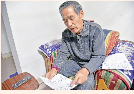
景尚林唱起自己创作的《济宁赞》。