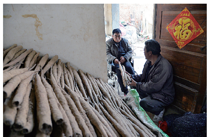
深入了解红斑山药种行情