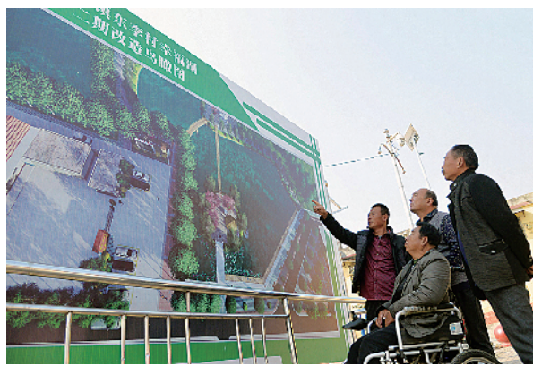
展望幸福湖二期改造工程