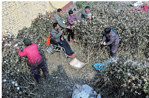
棉花晒场了解民情