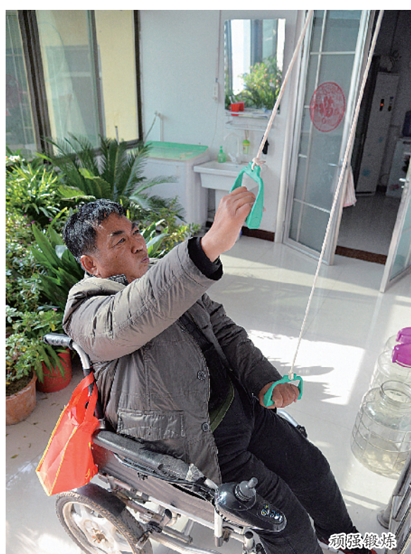
视察种植户芹菜长势