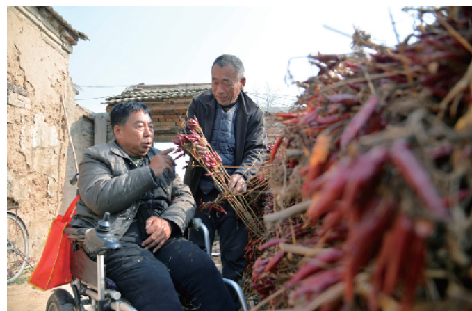
传授辣椒适时采收晾晒经验