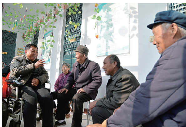
陪养老院老人聊天