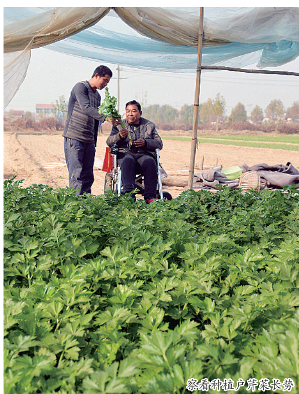
察看种植户芹菜长势