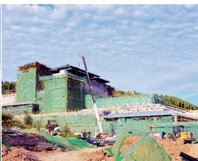
建设中的尼山圣境项目。

国无德不兴，人无德不立。2013年11月，习近平总书记视察济宁时作出了弘扬优秀传统文化、加强全社会思想道德建设等重要指示。三年多来，我市全力落实习近平总书记重要讲话精神，首善之区文化强市建设实现重大突破，“乡村儒学讲堂”现象在全国引起广泛关注，曲阜文化示范区列入国家“十三五”规划，干部政德教育在全国影响越来越大，儒学研究传播发出了孔子家乡“最强音”。