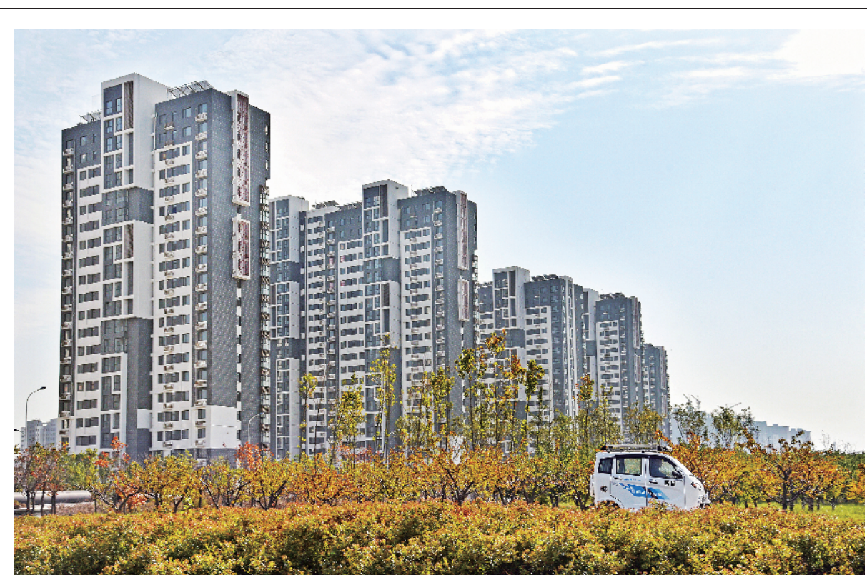
记者日前在市住建局了解到，截至10月31日，全市棚改开工新建和货币化安置70667户(套)，开工率为107.18%，超额完成了国家、省下达给我市的棚改任务。今年以来，我市把加快棚改作为改善民生的硬任务，全力推进旧城改造步伐，争取让老旧小区居民早日“出棚进楼”。图为济宁大运河河东片区回迁安置项目。

嘉祥县委县政府主要领导对重点党报党刊发行工作高度重视，专题听取全县重点党报党刊发行工作情况汇报，强调做好重点党报党刊发行工作是学习宣传贯彻党的十九大精神的重要举措，是增强党报党刊传播力和影响力的重要手段，各职能部门要把重点党报党刊征订作为一项严肃的政治任务，提高政治觉悟，强化责任担当，确保高标准高质量完成党报党刊工作。嘉祥县还成立了重点党报党刊发行工作督导组，对各党委、单位重点党报党刊发行进度进行督导检查，对于订阅大户、重点和难点部门进行重点督导，确保全面完成发行工作。