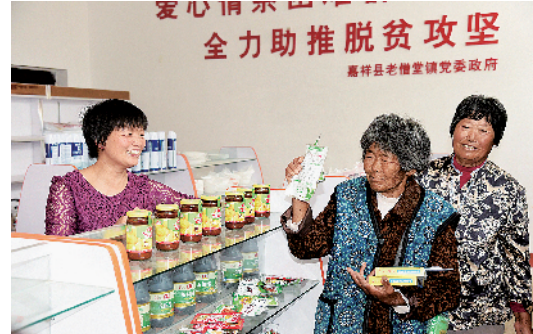
创办爱心超市，为贫困群众发放购物卡