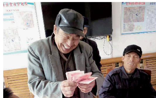
贫困户领到分红资金后喜笑颜开