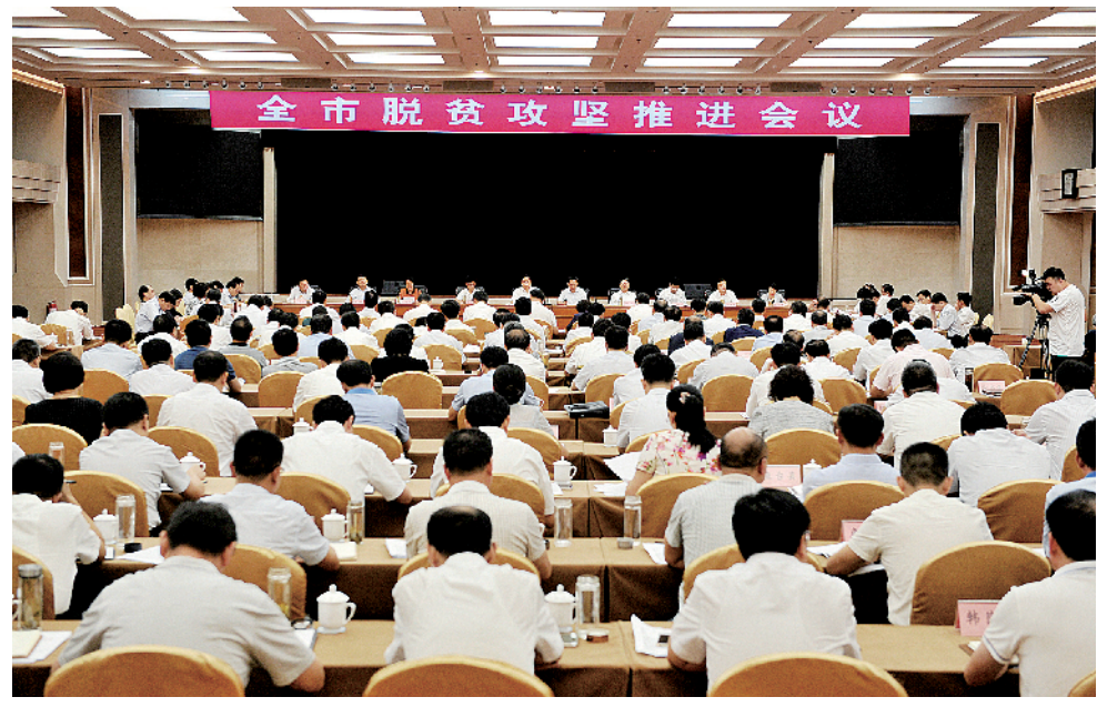
市委市政府召开全市脱贫攻坚推进会议，高位部署推动工作开展