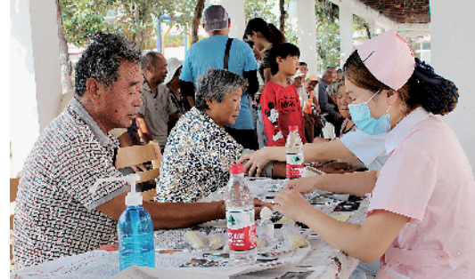
保健医生为贫困群众开展巡诊检查