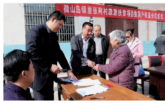
借助乡村旅游实施资产收益扶贫

雄关漫道真如铁，而今迈步从头越。我们将以习近平总书记扶贫开发重要战略思想为指导，坚持实事求是，把握正确方向，在解决好绝对贫困人口脱贫的基础上，积极探索建立稳定脱贫长效机制，统筹解决好相对贫困、城市贫困问题，把反贫困斗争持续引向深入，确保全市人民一道迈入全面小康社会！