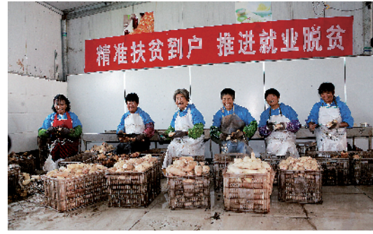
设立就业扶贫车间，让贫困群众增收、顾家“两不误”