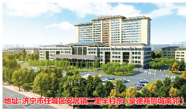
地址:济宁市任城区安居镇二里半村东(徽商商贸城南邻)